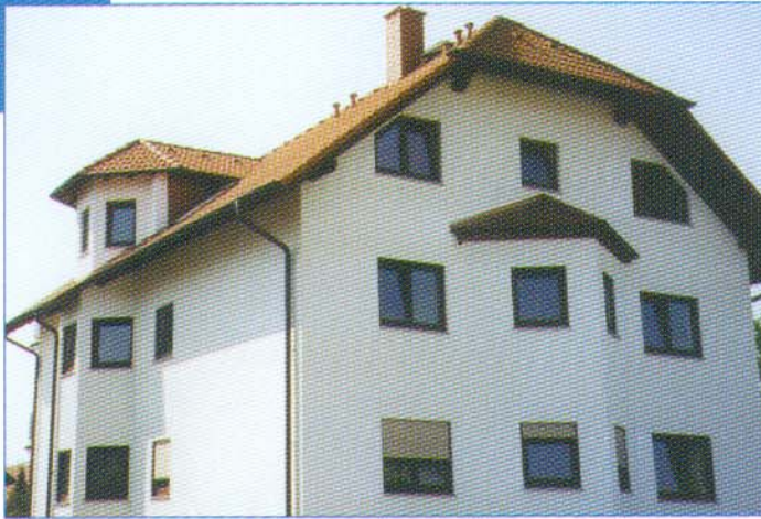
Mehrfamilien-Wohnhaus Frey Büttelborn, Ahornweg 7