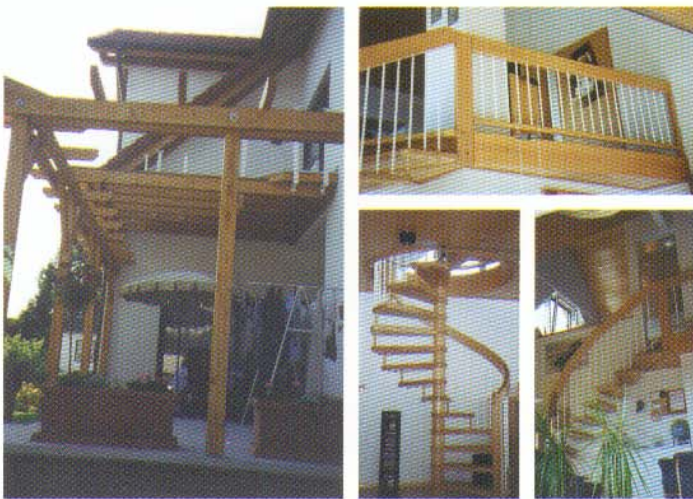
Hirsch Büttelborn, Ringstraße 14 Aufstockung/Umbau 1997

Es wird die Veränderung eines Gebäudes durch diese Maßnahme deutlich. Ein vorher vorhandenes Walmdach, ohne nutzbaren Dachraum, wird durch ein Giebeldach mit Drempel ersetzt und in zwei Ebenen genutzt. Raumgewinn 100 % und mehr möglich.