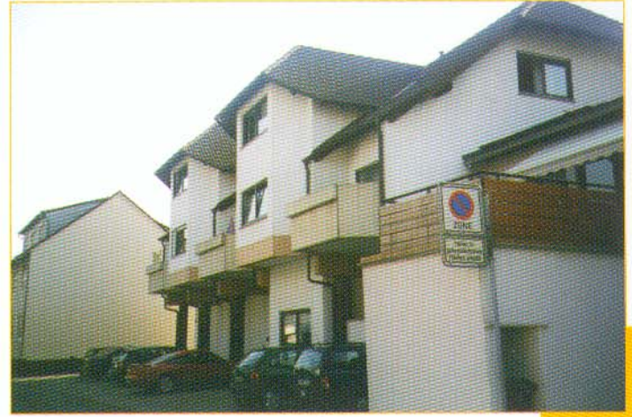
Aufstockung Kegelbahnen Friebl Büttelborn, Mainzer Straße 10