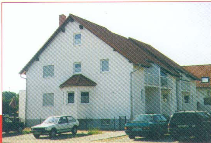
Reihenhaus Feldmann/Püschel Groß-Gerau/Nord, Am Hospitalstück 7 Erbaut 1997