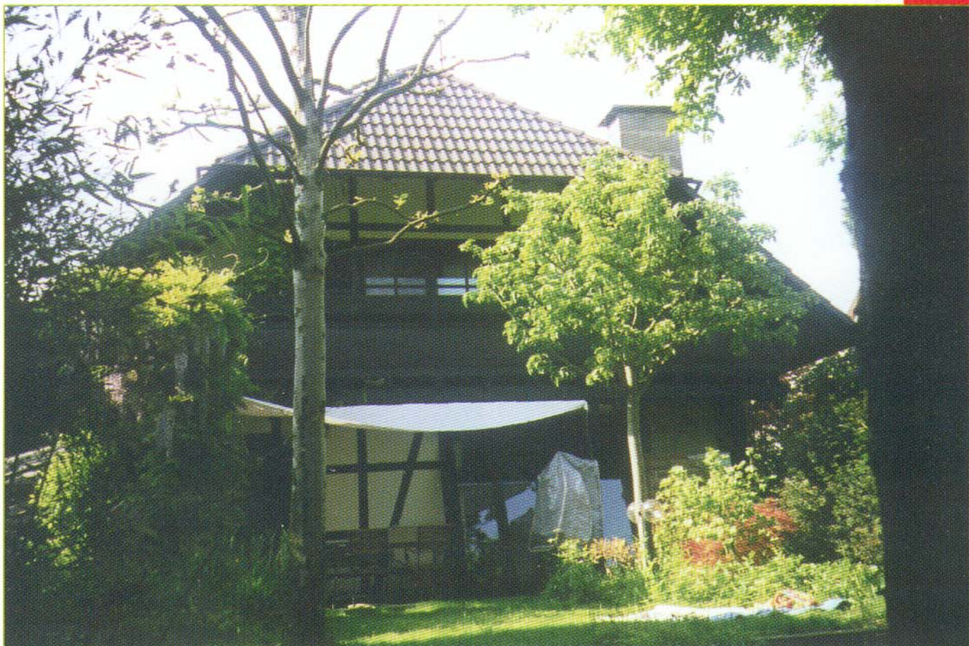
Einfamilien-Wohnhaus Bublitz Groß-Gerau/Wallerstädten, Auf dem Deich Erbaut 1982

Das Haus wurde mit einer Fachwerk-Vorsatzschale mit Hinterlüftung vor das tragende Mauerwerk plaziert. Durch Holzbalkone, Pergola und Carport hat das Haus seine eigene Note und ist auch heute noch ein Blickfang.