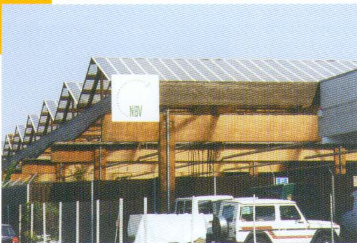
Markthalle der OGZ - Griesheim

Ausgeführt als reine Brettschicht - Leimholz - Konstruktion mit transparenter Bedachung. Die statische und konstruktive Bearbeitung wurde vom Ing.-Büro Hirsch ausgeführt.