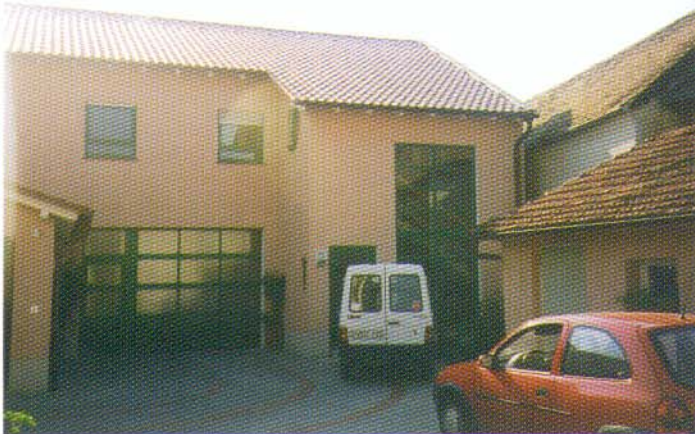
Kullmann Neubau Wohn- und Lagergebäude Büttelborn, Dornheimer Straße 7